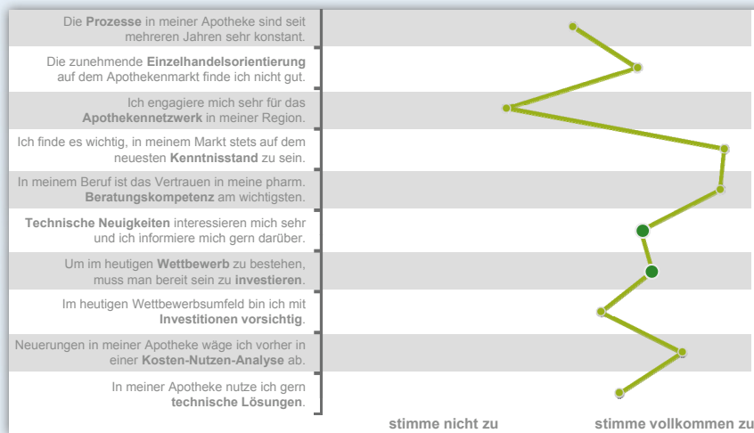
Abb. 1

In Abb. 1 wird ein Trend bei Apothekern besonders deutlich: Fast alle befragten Apotheker finden es zum einen wichtig, in ihrem Markt stets auf dem neusten Kenntnisstand zu sein. Zum anderen ist der Übersicht klar zu entnehmen, welche Bedeutung der pharmazeutischen Beratungskompetenz von Apothekern beigemessen wird. Ähnlich gewichtet sind die dunkelgrün hervorgehobenen Punkte zu technischen Neuerungen und zu der Bereitschaft, Investitionen zu tätigen, um im Wettbewerb mithalten zu können.